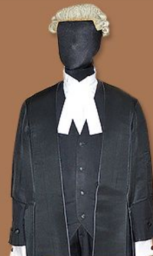
上訴法庭 法官袍及禮儀袍 月薪： 25.7萬元