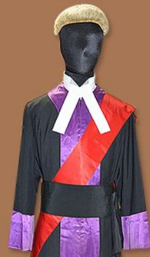
區域法院 法官袍 月薪： 約14.5萬元