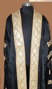
終審法院首席法官 禮儀袍 月薪： 約29.3萬元