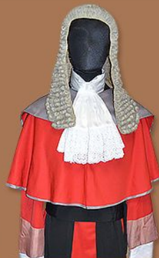
原訟法庭 法官禮儀袍 月薪： 約24.5萬元